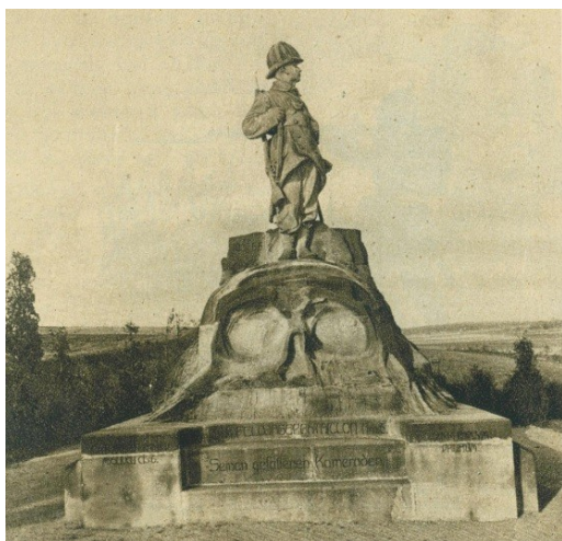
Pomník prusko-rakouské války z r. 1866 na Vysokově u Náchoda

Pruské vojsko mělo Českou Skalici obsazenu od 1. července až do 2. srpna 1866.